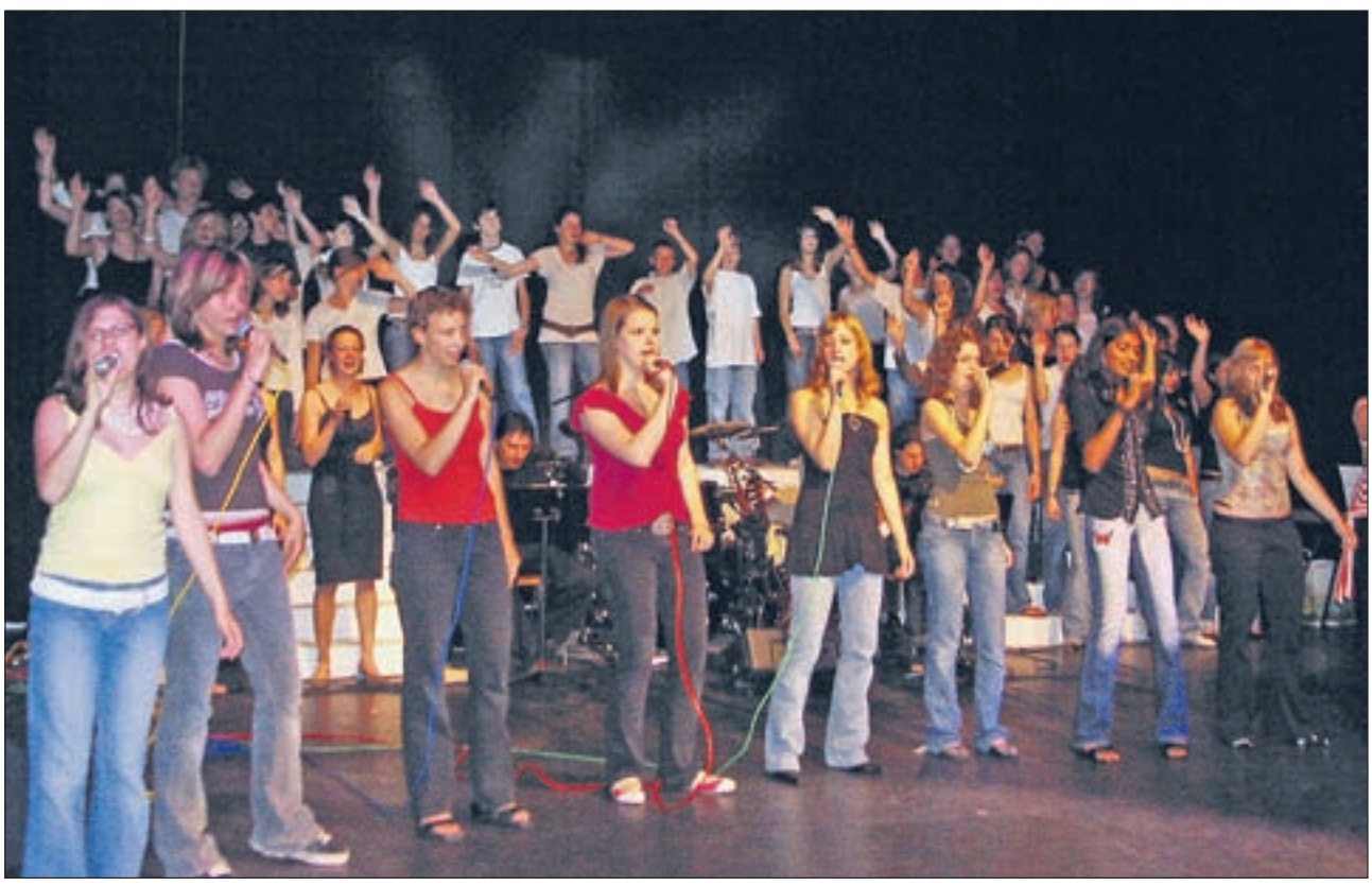
Zum Schlusslied «Lean on me» vereinigten sich der Chor und die Vokalgruppen auf der Bühne.